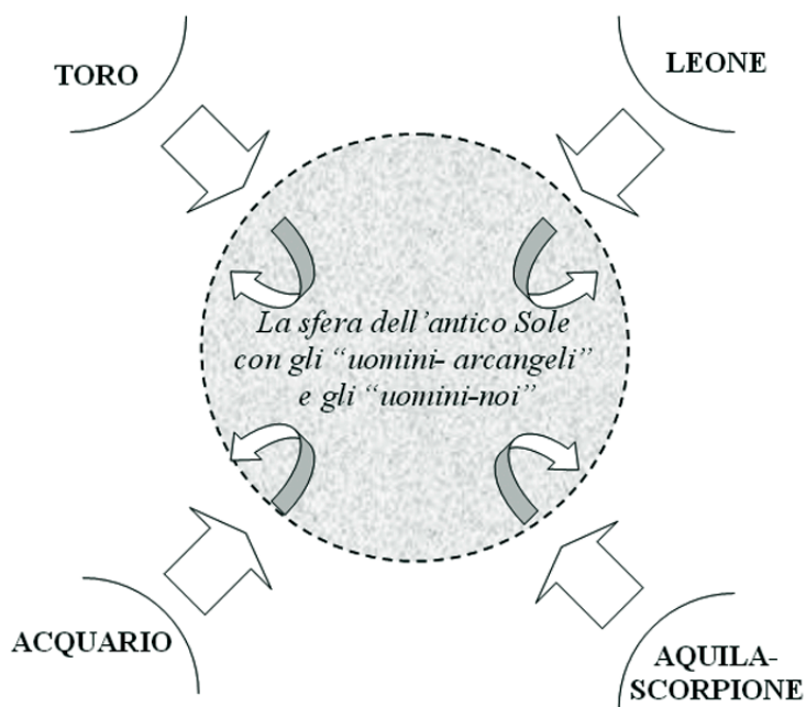
La formazione dello Zodiaco da quattro direzioni cosmiche

situazione cambiò radicalmente. Vi furono uomini-noi che vollero restare nella Luce e quindi si muovevano sull'antico Sole in modo da restare sempre esposti alla Luce proveniente da Toro, Leone e Acquario, e uomini-noi che preferirono unirsi alle tenebre dello Scorpione. Una terza categoria restò intermedia tra le due.